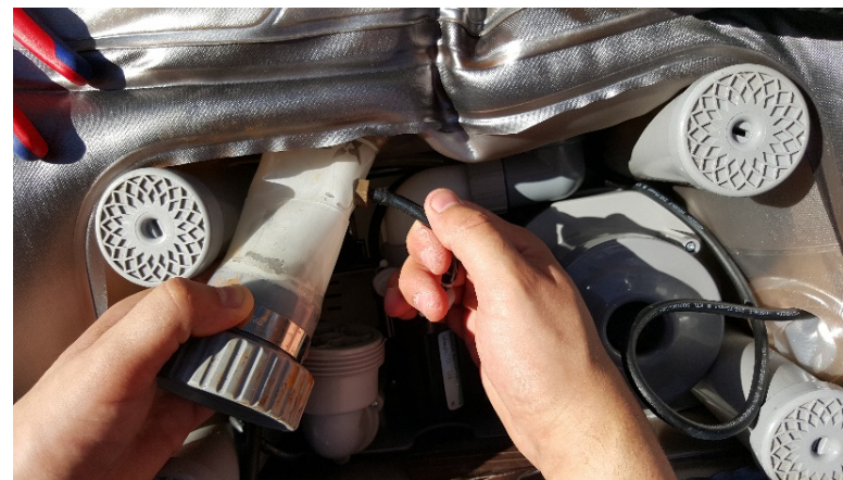
8. Ta av svarte Ozon slangen