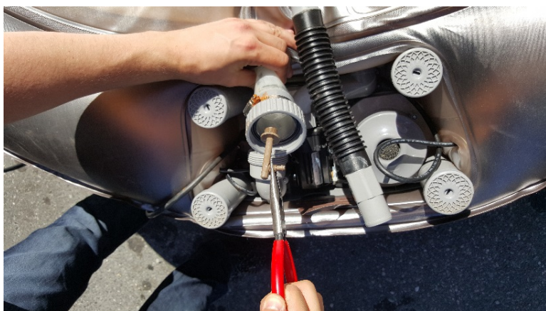
11. Bruk nebtangen til å ta ut ozon festet og sett in en ny en