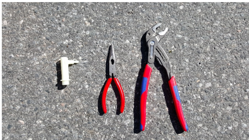
1. Du trenger tilsvarende verktøy + reservedeler