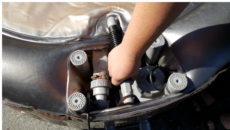
5. Flytt bort drenerings røret