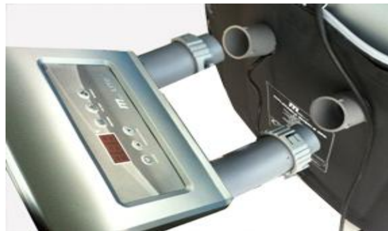
2. Ta av display panelet