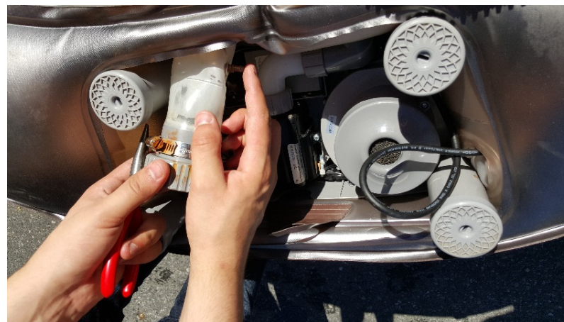
10. Dytt in Ozon festet, også fra insiden av badet