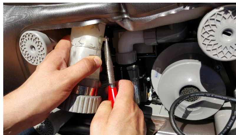
12. Dra Ozon festet ut og fest alt som tidligere.