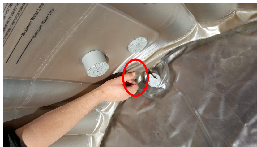
4. Skru av ozon korken