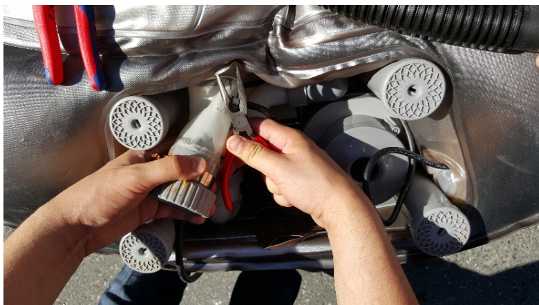
7. Klipp av stripsen