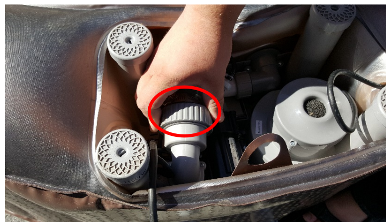
6. Skru løs slangen