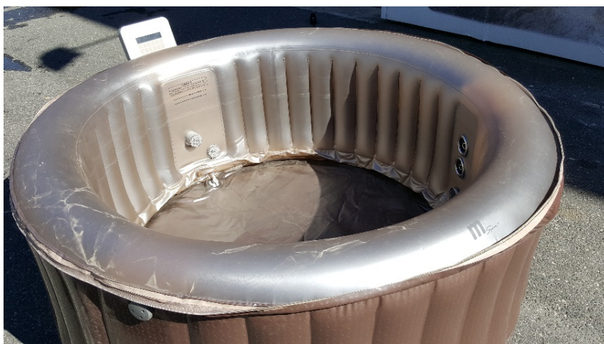
3. Tøm badet for vann